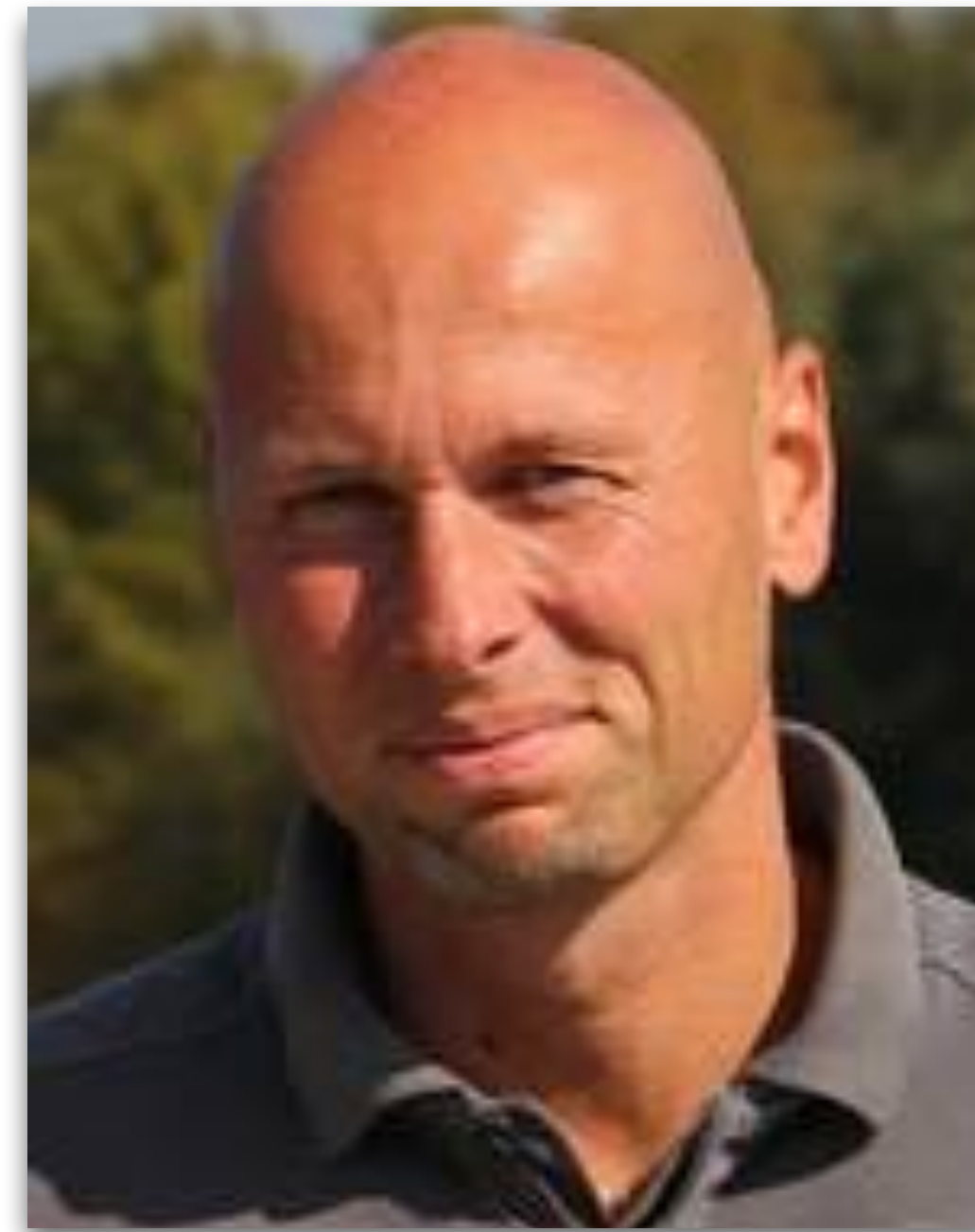
TSA-Referent Technischer Spielbetrieb