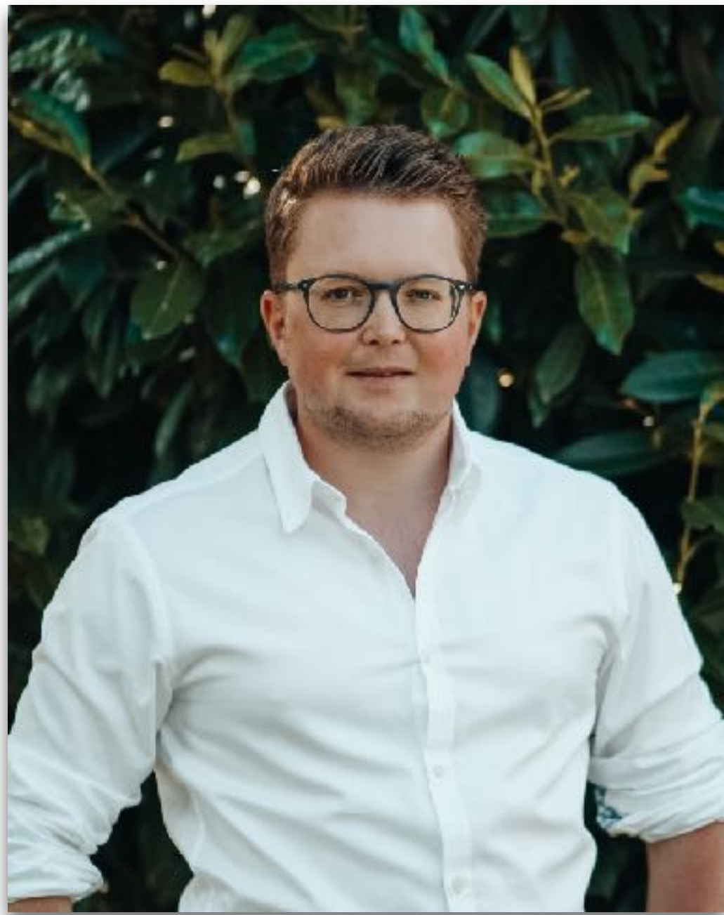
TSA-Vizepräsident und Ressortleiter Sport